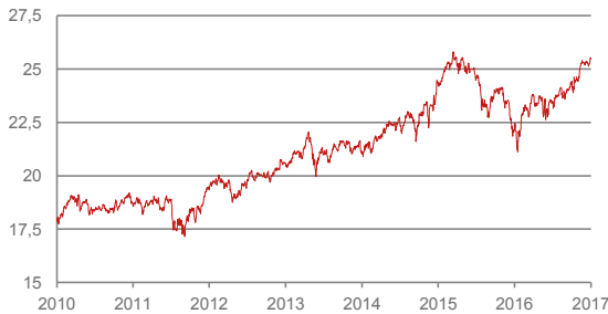
■ Evolution de la valeur d'inventaire