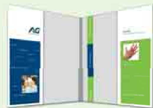
Een algemeen overzicht van uw premies